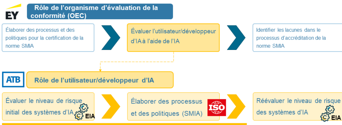
Figure 2 : Déroulement du projet d'évaluation basé sur la norme SMIA

Les résultats détaillés sont présentés dans le rapport final du Fonds de dépenses d'expérimentation réglementaire du Centre d'innovation en matière de réglementation, intitulé « Piloting an Accreditation Program for the Assessment of Artificial Intelligence Management Systems » (Projet pilote de programme d'accréditation pour l'évaluation des systèmes de gestion de l'IA), disponible sur demande.