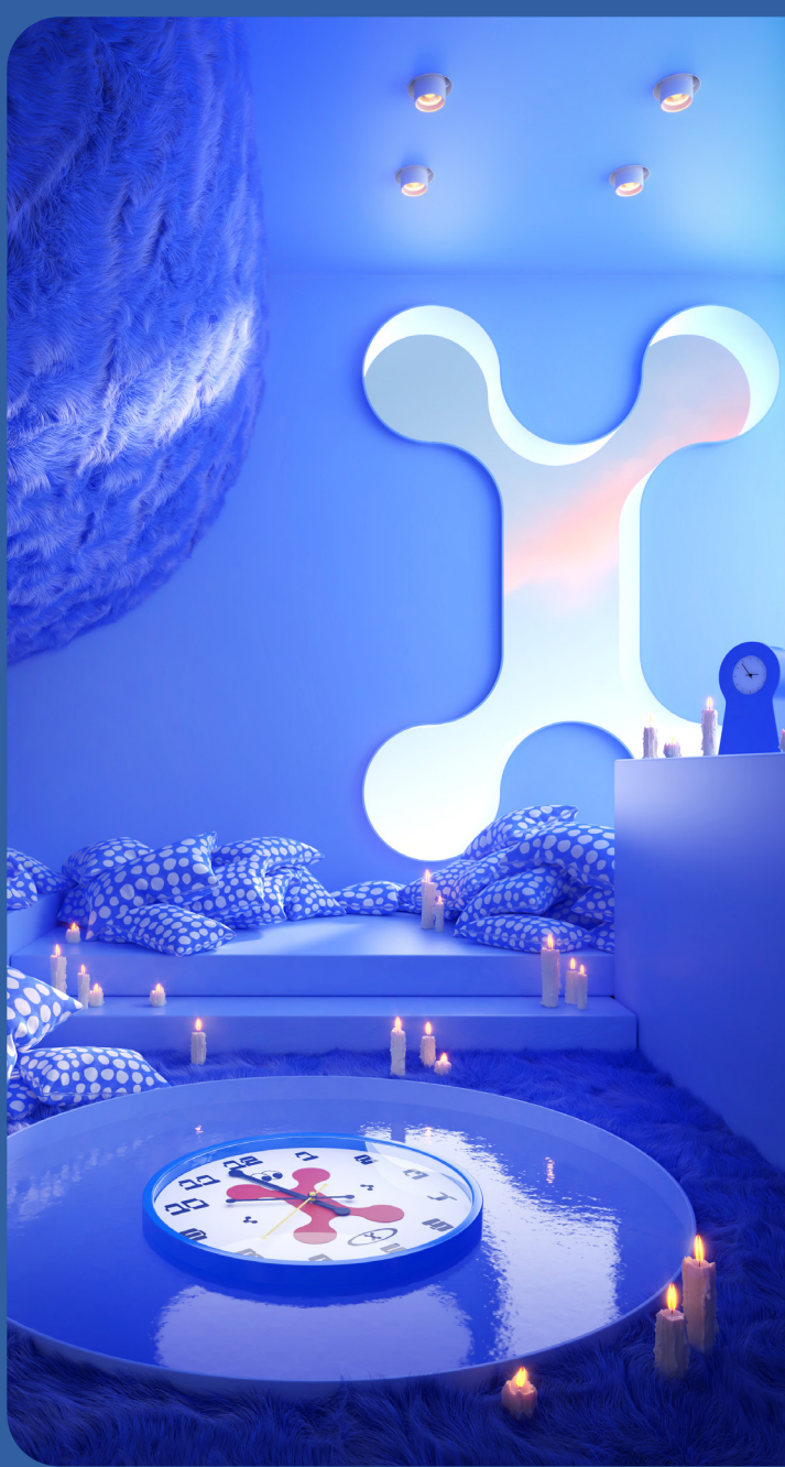
Image d'inspiration 3D

Et comme l'ADN nous rend tous unique, celui présent dans le chromosome ZYKEA nous plonge dans un espace tout aussi singulier : une machine à rêves dans un espace consacré au sommeil ; un refuge pour les pensifs, les songeurs, les têtes en l'air et les têtes dans les nuages ; un lieu de repos qui active les canaux de l'imaginaire grâce à une architecture obsessionnelle et accumulative. IKEA et le studio ZYVA en sont persuadés : il suffit parfois d'une légère torsion à l'habituel, pour rendre le quotidien plus beau , particulièrement dans la chambre, cet espace intime et personnel, infiniment connecté à la rêverie et au sommeil.