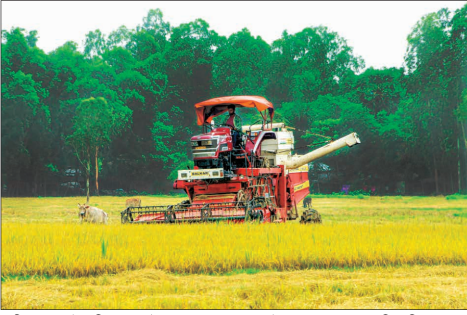
জমিতে হারভেস্টার দিয়ে ধান কাটার কাজ চলছে। বালুরঘাটের চকভূঙ্গ এলাকায়।