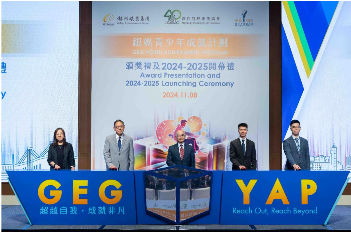
P002：澳門特區政府教育及青年發展局青年試館中心主任柯敏茵女士、銀娛董事程裕昇先生、管協理事長劉永誠先生、澳門特區政府勞工事務局職業安全健康廳廳長李錫樵先生及中央人民政府駐澳門特別行政區聯絡辦公室經濟部助理趙速先生（由左至右）任主禮嘉賓。