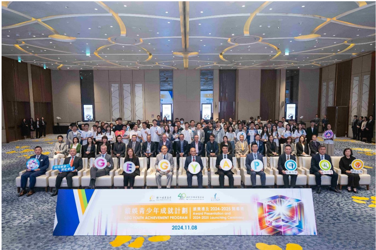
P001：銀娛與管協於今日在銀河國際會議中心舉行第 13 屆頒獎禮及第 14 屆開幕禮。