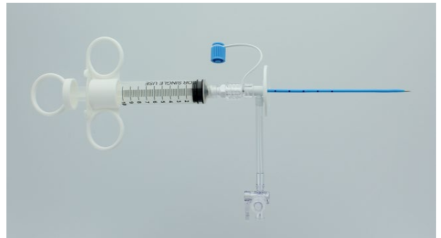
Illustration 2 : Cathéter de thoracentèse Rocket 6 fg (R51551)