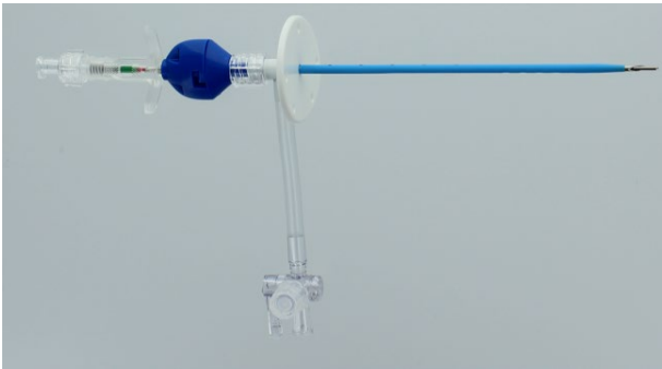
Illustration 1 : Cathéter de thoracentèse Rocket 8 fg (R51551-08-00)