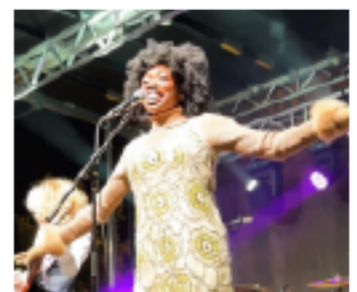
Bank of America Fall for Greenville

Text "GVLthisWeek" to 866-874-2232 to receive the Week in Review newsletter in a text message every Friday.