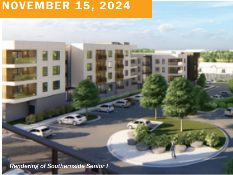
Rendering of Southernside Senior I