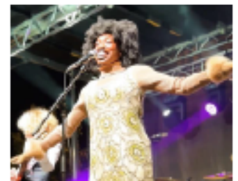
Bank of America Fall for Greenville

Envíe un mensaje de texto con la palabra "GVLthisWeek" al 866-874-2232 para recibir el boletín Week in Review en un mensaje de texto todos los viernes por la tarde.