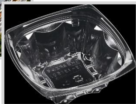
エコ透明容器 (ボトル to 透明容器)