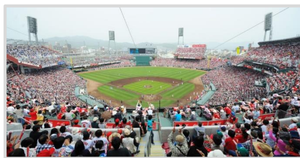
MAZDA Zoom-Zoom スタジアム広島