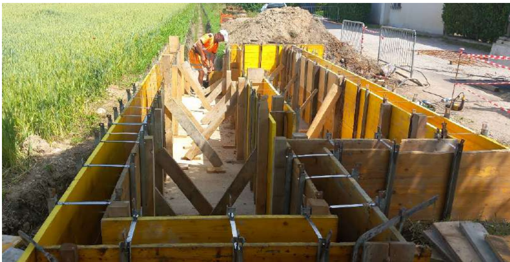
ROGGIA BOSCHETTI, realizzazione di un nuovo manufatto sfioratore con griglia nei pressi di via Decumana in comune di Cittadella;