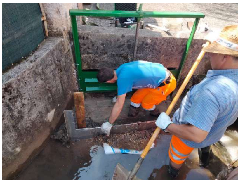
SCOLO MAGLIO, sostituzione lama di deviazione con nuova paratoia a verme scolo Maglio in via Maglio in comune di Breganze;