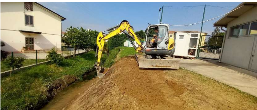
ROGGIA RIALE, sistemazione sponda sinistra per circa 10 metri in via Dante Alighieri in comune di Grumolo delle Abbadesse;