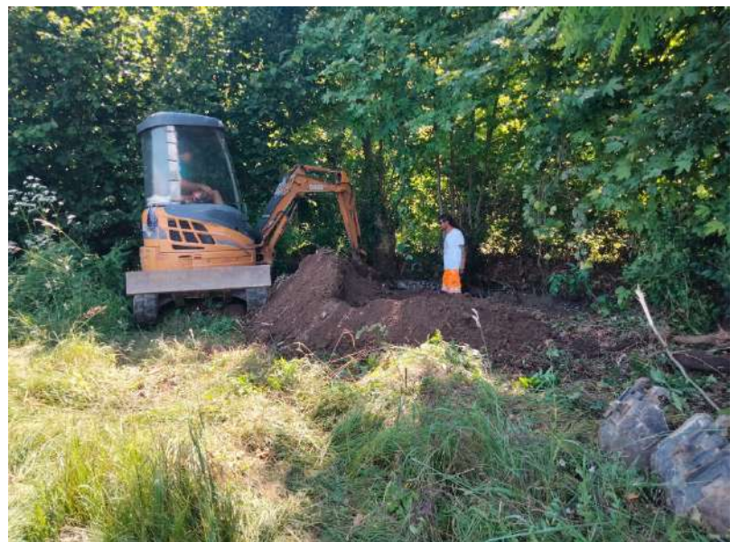
CANALETTA SIMIONI, arginatura canaletta per circa 30 metri in Via Campagnola in comune di Rosà;