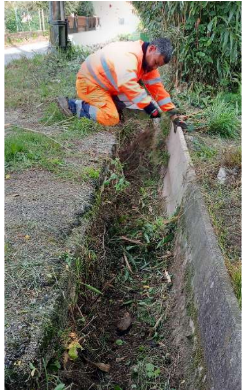
CANALETTA DAGIO E ZAMBELLO, rimozione di una canaletta per la lunghezza di 5 metri in Rossini in comune di Rosà;