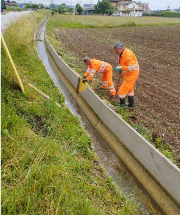
CANALETTA POZZO MAI, riparazione canalette in via Nova in comune di Cittadella;