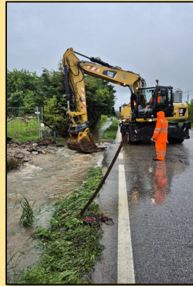
ALTRA PIOGGIA CRITICA E ALLAGAMENTI