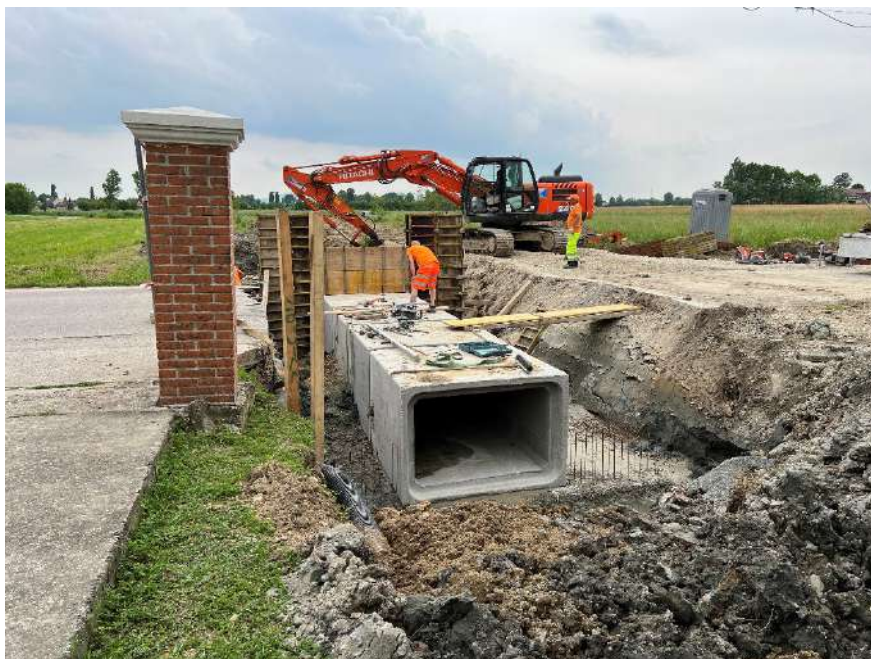
risezionamento e nuovo collegamento tra gli scoli Liminella Padovana e Liminella Vicentina in comune di Campodoro.

Si è recentemente concluso l'affidamento per la modernizzazione di vari impianti pluvirrigui, finanziato dal Ministero dell'Agricoltura.