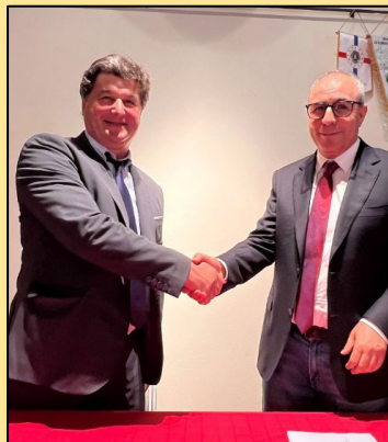
ACCORDO CON IL MAROCCO