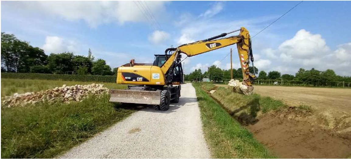
SCOLO ISOLA, sistemazione spondale in più punti per una estensione di circa 30 metri in via Grantorto in comune di Piazzola sul Brenta;