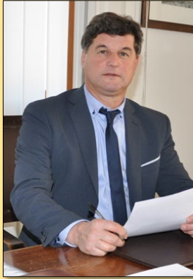
EVENTO METEO INTENSO