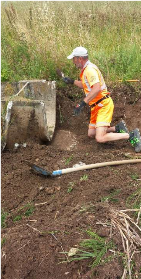
ROGGIA ALTA VICA, sostituzione canalette per una lunghezza di 25 metri ad ovest di via della Salute in comune di Cittadella;