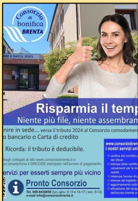
AVVISO DI PAGAMENTO ANNO 2024