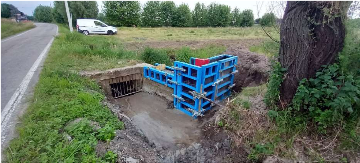
ROGGIA PUINA ALTA, ammodernamento del manufatto con ricostruzione di una spalletta in via San Giuseppe in comune di Gazzo;