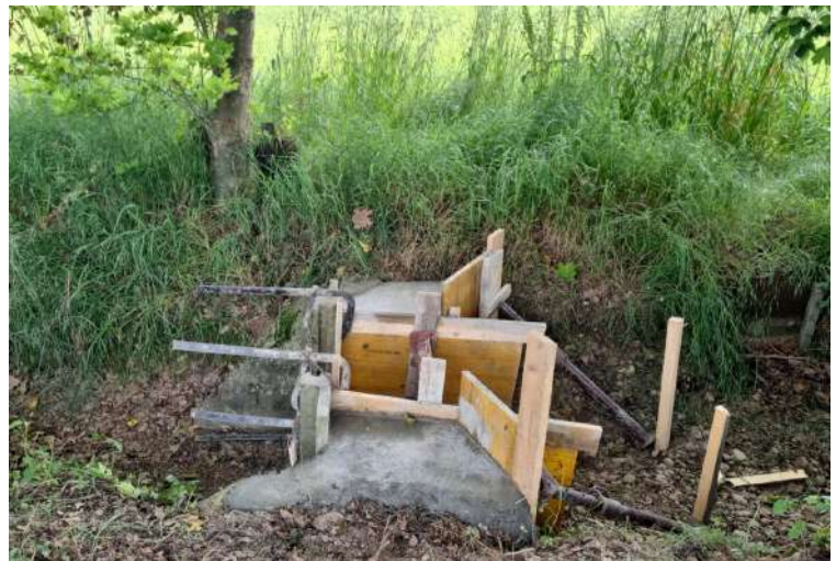
CANALE CENTRALE, posa di una griglia in via Madonna della Salute in comune di Mussolente;