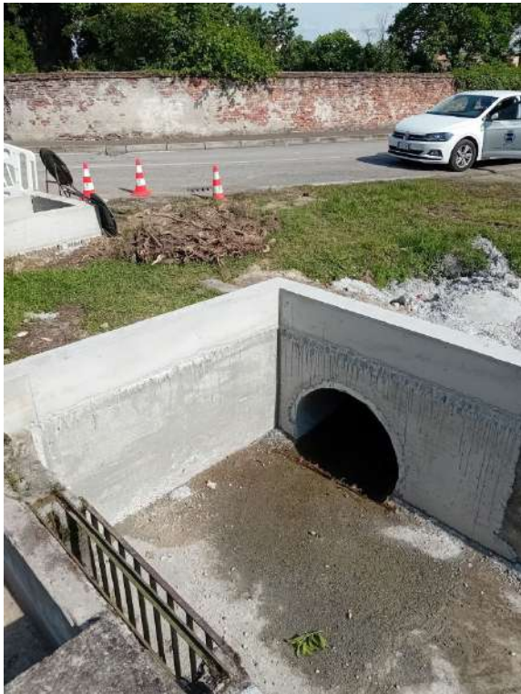
BOCCHETTO PIOVEGO TORREROSSA , stuccatura manufatto idraulico in via Cornoleo di Sotto in comune di Camisano Vicentino;