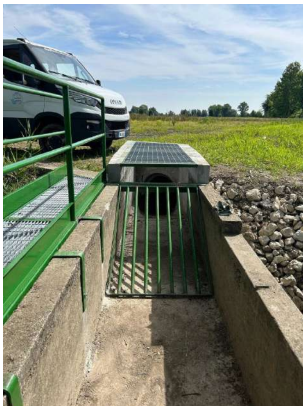
ROGGIA PILA, posa nuovo grigliato di protezione su roggia Pila in località Grossa in via Sauro in comune di Gazzo;