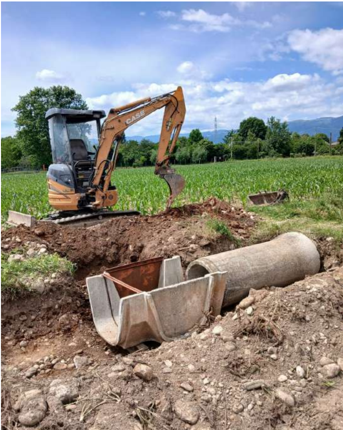
ROGGIA GALLA CUSINATI, ampliamento ponticello per transito mezzi consortili e posa di una nuova deviazione ad ovest di Via Roncalli in comune di Rosà;