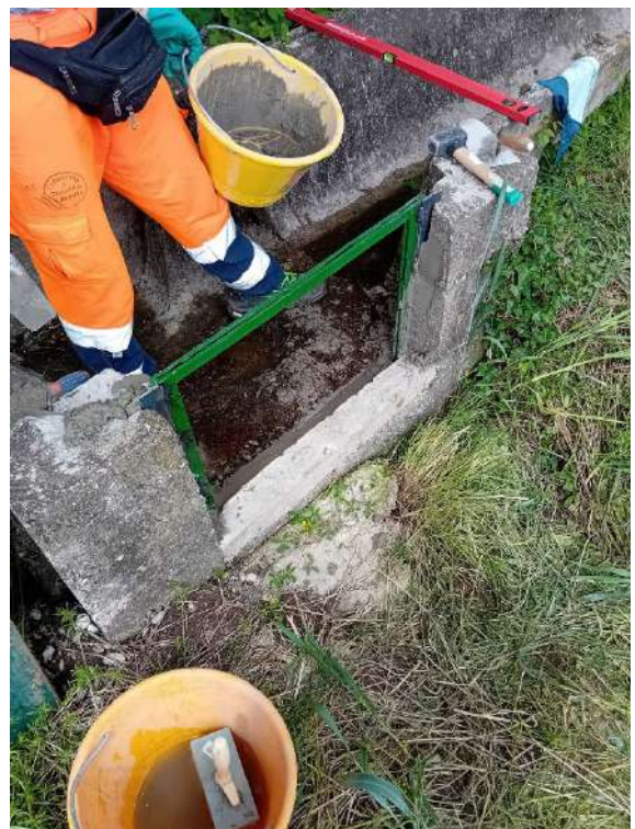
BOCCHETTO GOLENA BRENTA , sostituzione di una paratoia in via Maglio in comune di Carmignano di Brenta;