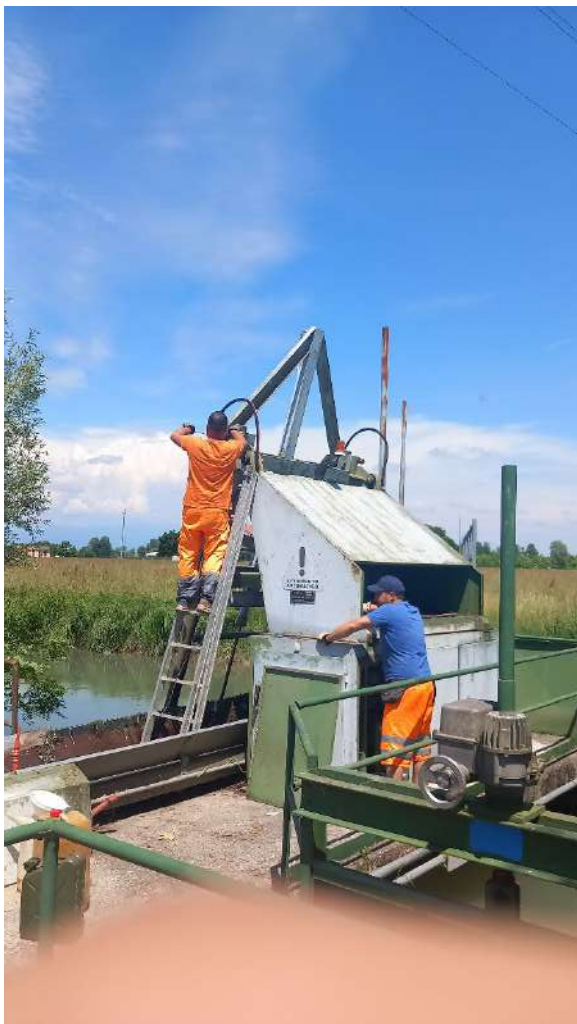
ROGGIA CONTARINA, manutenzione sgrigliatore in via Monache in comune di Piazzola sul Brenta via Monache;