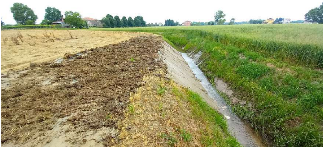
SCOLO POZZON, consolidamento della sponda destra per circa 10 metri in via San Zeno in comune di Veggiano;