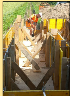
LAVORI IN CORSO