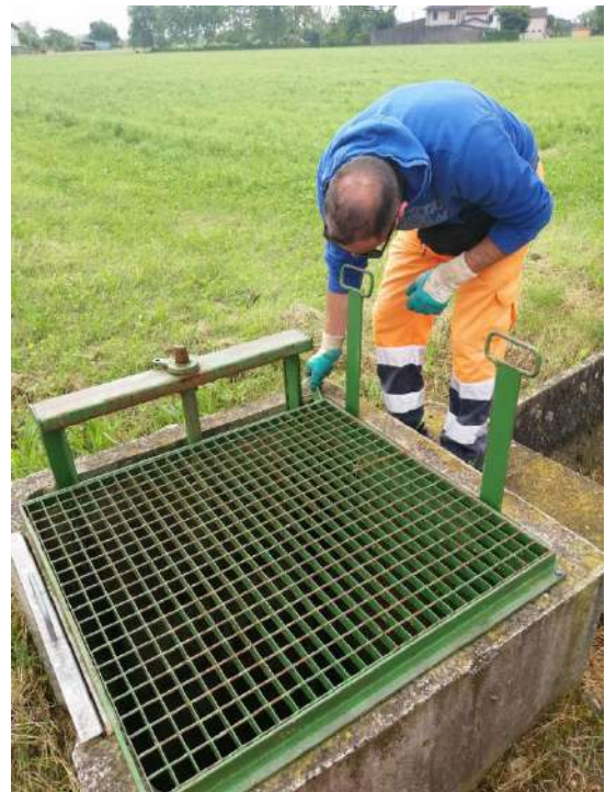
CANALETTA POZZO BELVEDERE, stuccatura del manufatto in via Maglio in comune di Carmignano di Brenta;