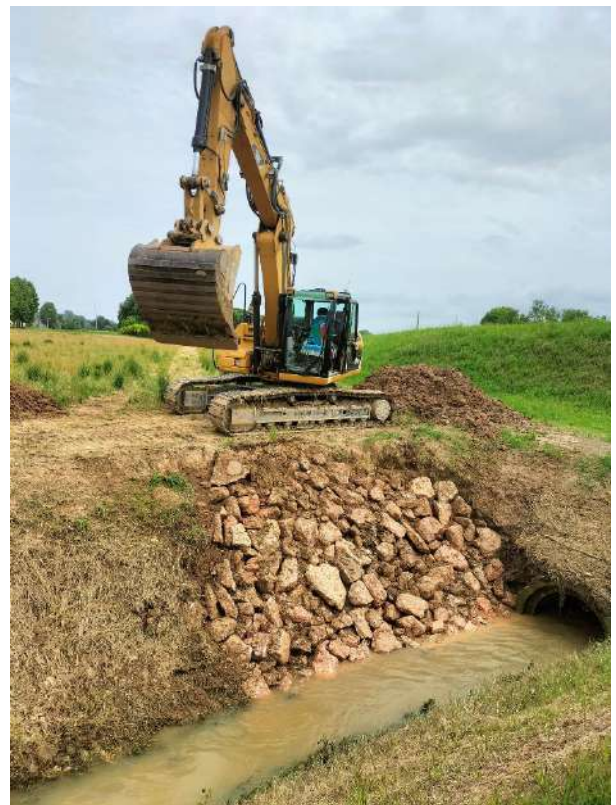
SCOLO RESTELLO, sistemazione spondale per circa 10 metri in via Giuseppe Roi in comune di Montegalda;