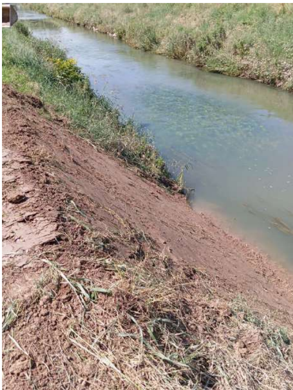
RIO TESINELLA, sistemazione sponda sinistra per una lunghezza di circa 10 metri in via Sguazzina in comune di Veggiano;