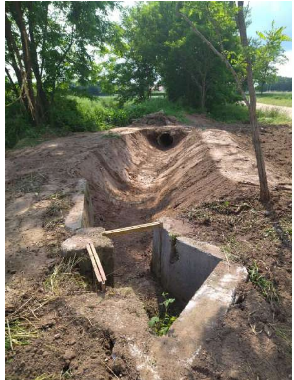
CANALETTA POZZO MACELLO CITTADELLA SX, ripristino della funzionalità idraulica del manufatto irriguo sito nei pressi di via Bonarda in comune di Cittadella;