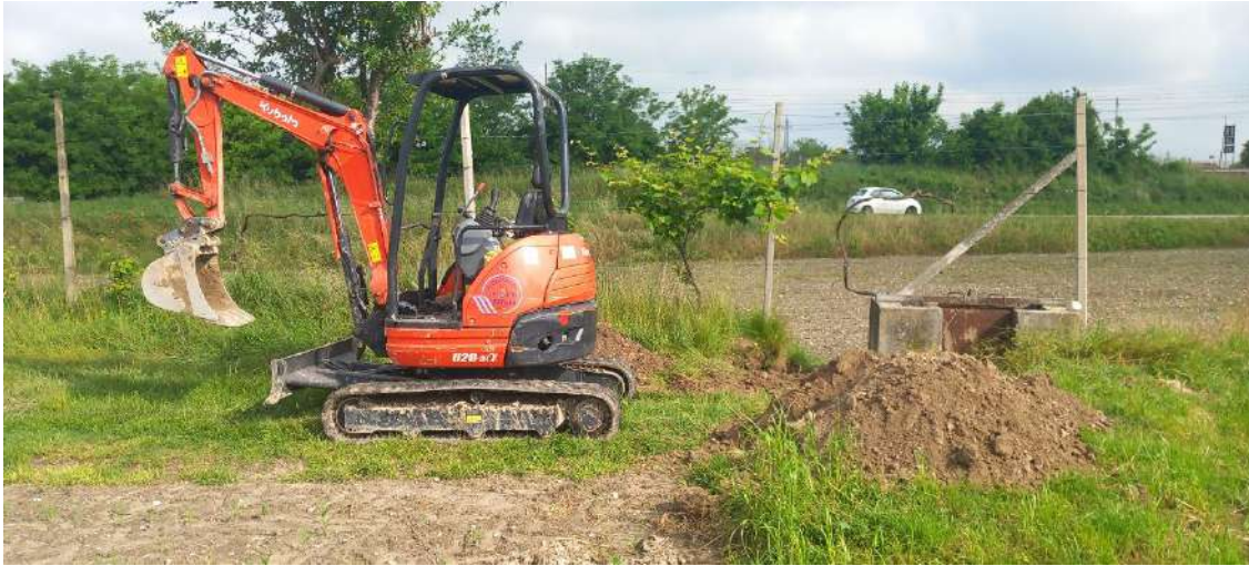
CANALETTA POZZO OSPITALE, riparazione di un manufatto in via delle Giare in comune di Fontaniva;