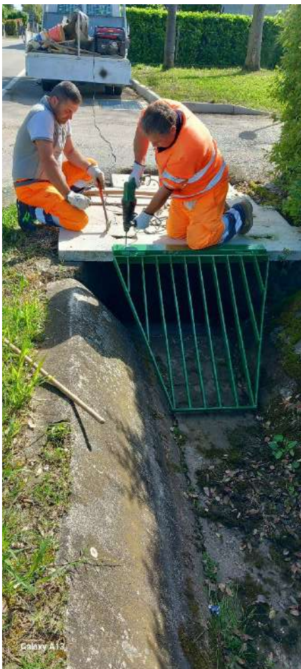
CANALETTA VASOIN, ammodernamento del manufatto irriguo in Casonetto in comune di Cittadella;