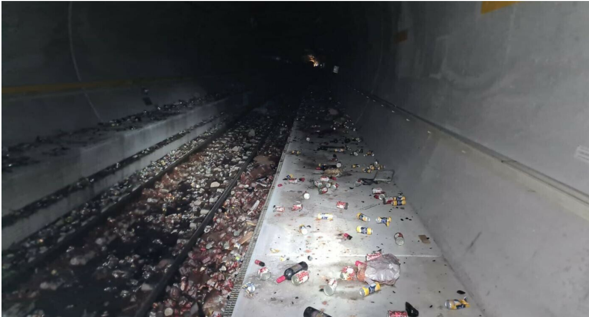
L'intero carico del vagone deragliato si è sparsa sulle rotaie e sulle rampe.

L'incidente nella galleria di base del San Gottardo si è verificato nel primo pomeriggio di giovedì 10 agosto 2023 presso la stazione multifunzione di Faido. Il treno merci coinvolto era diretto a nord. Non si conoscono le cause del deragliamento del vagone di un treno merci, né l'esatta entità dei danni. È stato chiamato il Servizio d'inchiesta svizzero sulla sicurezza (SIS). Gli esperti delle FFS stanno attualmente indagando sui danni. In particolare, controllano la carreggiata e la linea di contatto per individuare eventuali danni. L'interruzione della galleria di base del San Gottardo durerà almeno fino alla fine della giornata. Una prognosi più precisa potrà essere fatta solo dopo aver analizzato l'entità del danno.