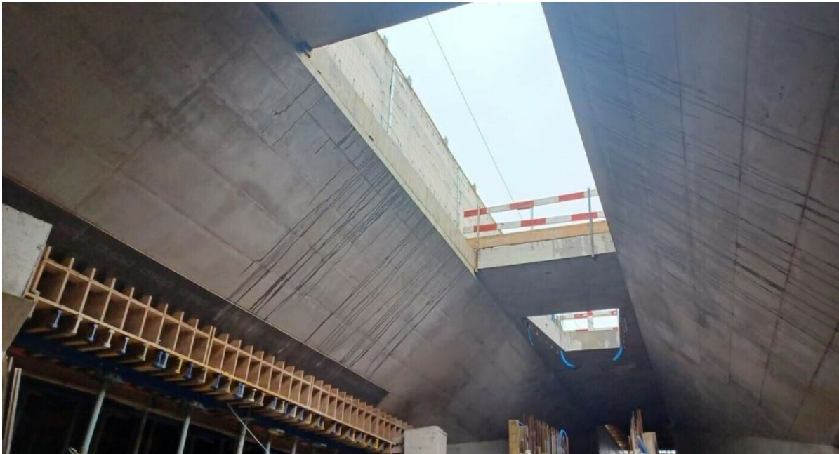
Uno dei tre lucernari del futuro sottopasso di Besso a dicembre 2023.