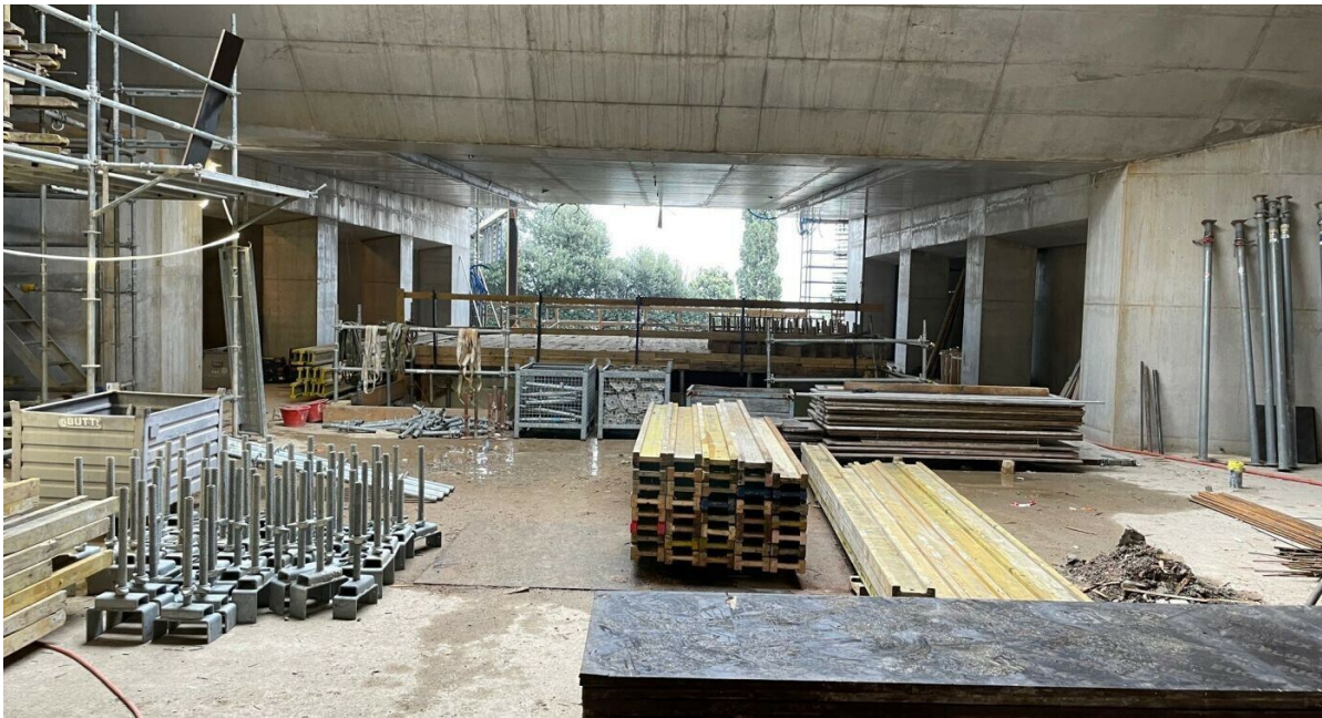
Il cantiere del nuovo sottopasso di Besso e l'apertura su via Bertaccio a dicembre 2023.

Si prega di prestare attenzione gli annunci in stazione e di consultare l'App Mobile FFS