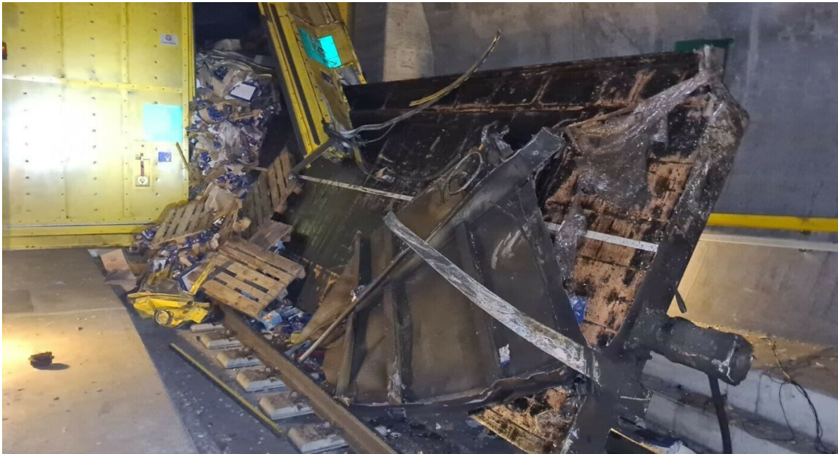
Il carro merci deragliato e completamente distrutto urta e danneggia il portone giallo di cambio binario.