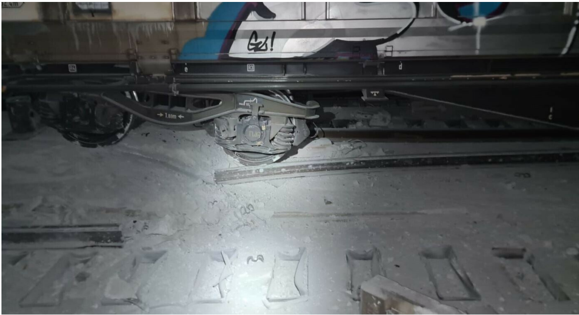
I vagoni del carro merci deragliati danneggiano gravemente le rotaie e le traversine.