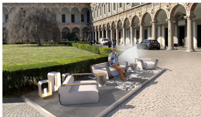
6-13 giugno, Cortile d'Onore Università degli Studi di Milano

INTERNI Design Re-Generation. Pininfarina Architecture progetta Wave , due lounge arredate con la Collezione Higold Onda disegnata da Pininfarina. Il progetto analizza la mutevole relazione tra ambienti indoor e outdoor proponendo un luogo ibrido, versatile, che supera le rigide convenzioni spaziali integrando arredi e finiture che fanno parte di mondi diversi: la casa e il giardino. Hanno collaborato al progetto Ceramica Fioranese per la pavimentazione, Zumtobel per il sistema di illuminazione e Nieder per la bordatura metallica. Pininfarina Architecture e Higold hanno inoltre curato la progettazione e l'allestimento della Lounge di Interni all'interno del Salone del Mobile. ▶