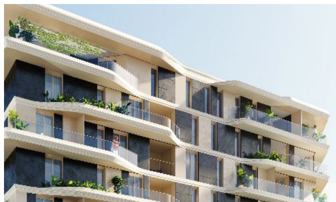
6-12 giugno, Palazzo Bandello