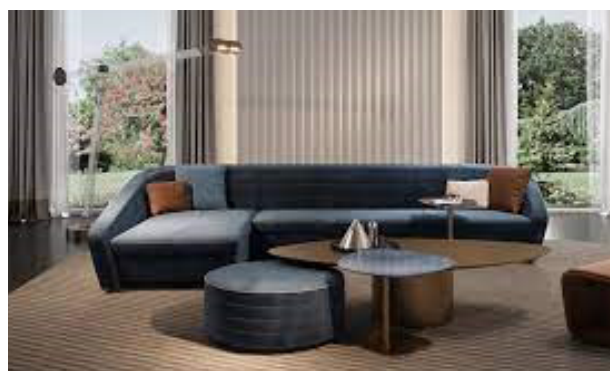
Salone del Mobile – Pad 05 Stand L03 M02 9 giugno ore 19:00 Reflex showroom – via Madonnina 17.

Reflex. Presentazione dei divani Statum e Granturismo nell'area dedicata a Pininfarina sullo stand Reflex. Pavimentazioni con Parquet Corà Miraggio design by Pininfarina.