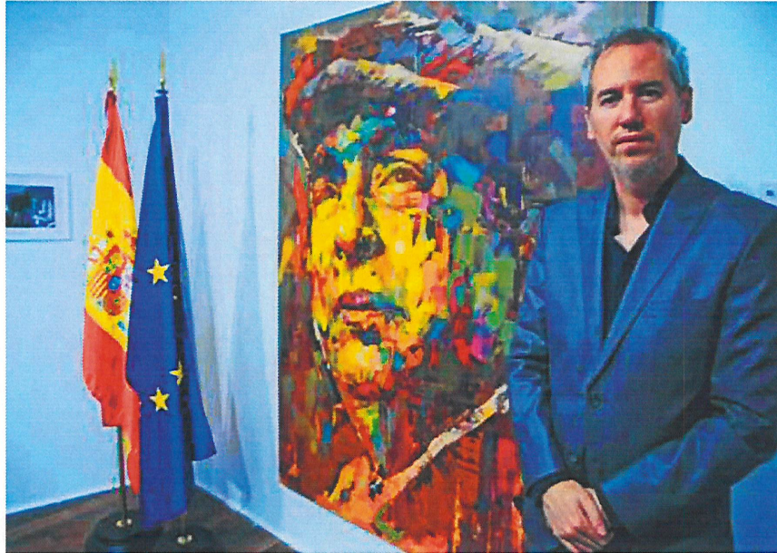
Alberto Ramírez Leg retrata a quince autores iberoamericanos.

Una vez el espectador mira fijamente una de las obras, se envuelve dentro de una sensación en la que inmediatamente sentirá que se sumerge dentro del