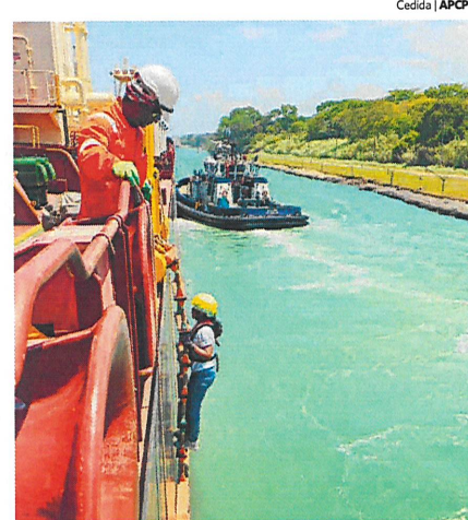
Los nuevos acuerdos de la OMI buscan reforzar las normas de seguridad para los métodos de transferencia de prácticos.

Con los nuevos acuerdos, las organizaciones buscan reforzar las normas de