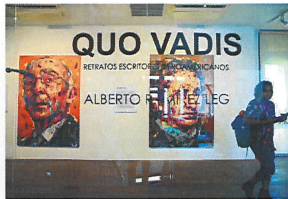
La exposición se puede visitar en la Casa del Soldado.

rostro del autor o la autora. Con un gran sentido expresionista, las obras son la representación de las fotografías que el artista escogió para plasmarlas en el lienzo. El artista recomienda al visitante de la exposición mirar los cuadros a distancia ya que hay detalles peculiares como la forma en la que los distintos colores representan las facciones de los protagonistas de una forma viva y colorida.