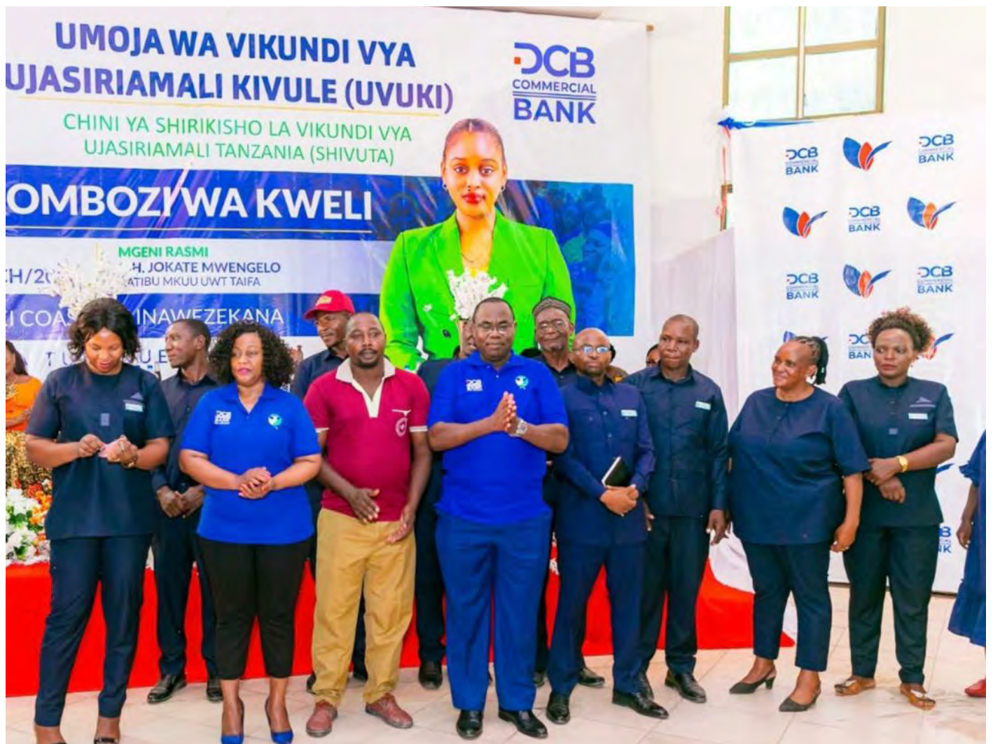
Mkurugenzi akiwa katika sherehe ya uzinduzi wa mradi wa shirikikisho la Vikundi vya Ujasiriliamali Tanzania (SHIVUTA)