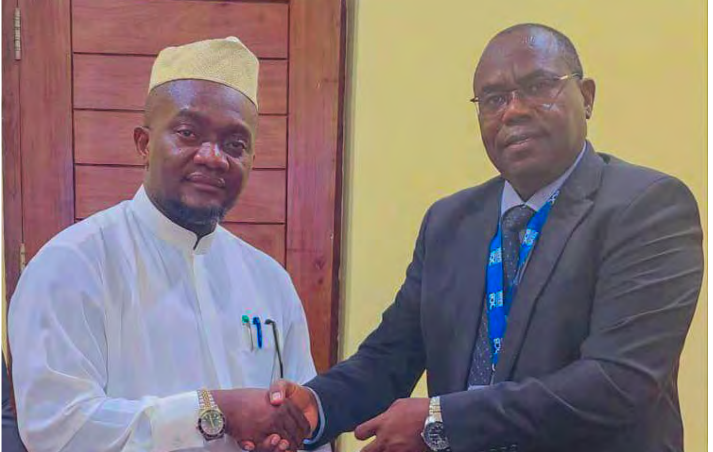
Mkurugenzi Mtendaji wa benki akiwa katika ziara ya heshima kwa Mh, Mohamed Omary Mchengerwa, Waziri wa Nchi Ofisi ya Rais, TAMISEMI, kujadili mbinu za kibiashara za kushirikisha wananchi katika maendeleo.