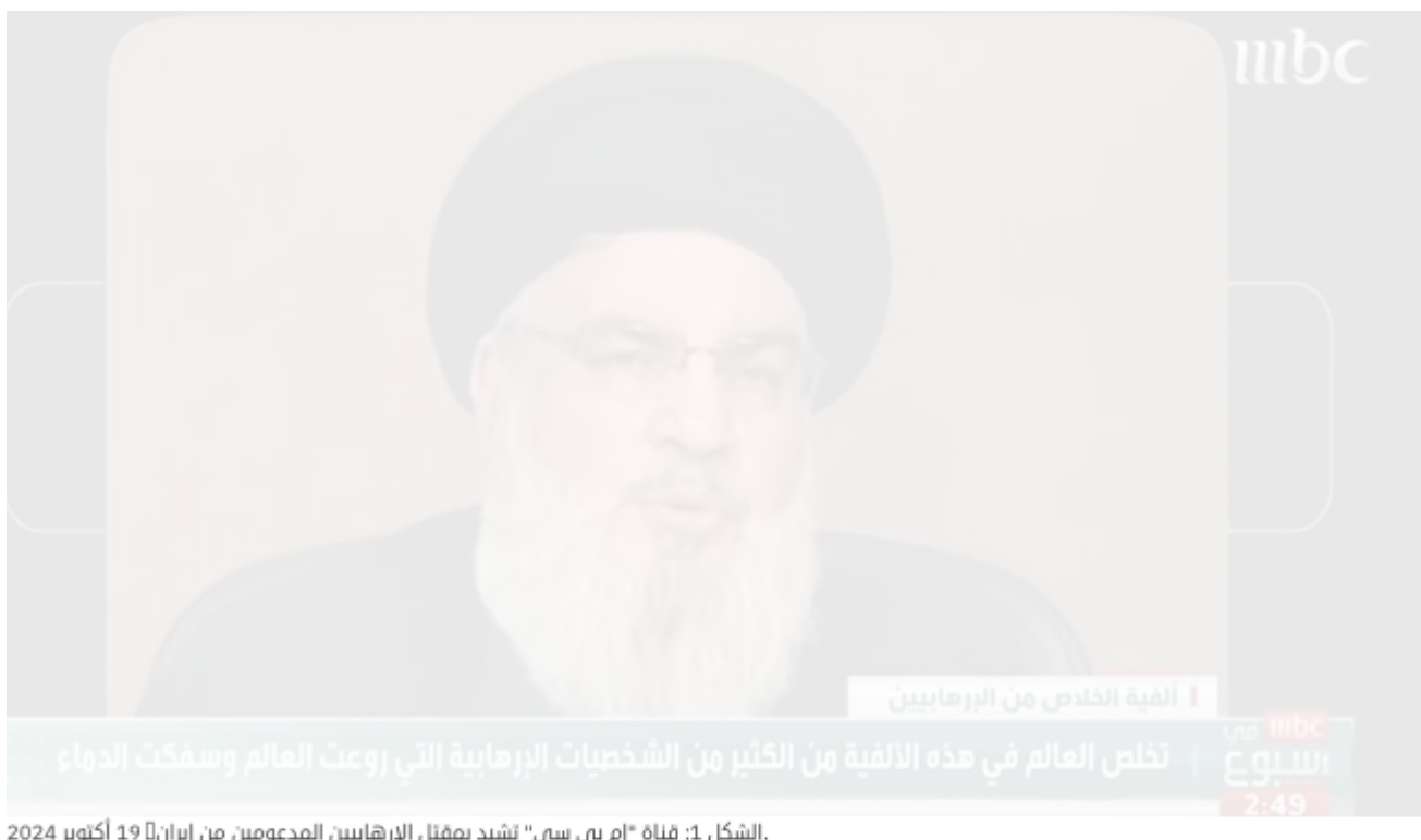
الشكل 1: قناة "إم بي سي" تشيد بمقتل الإرهابيين المدعومين من إيران 19 أكتوبر 2024.

دفعت التغطية الإعلامية الخليجية المستفزة بشأن مقتل قادة إرهابيين "كتائب حزب الله" إلى إطلاق أعمال عنف غوغائية ضد مكاتب شبكة "إم بي سي" في بغداد.